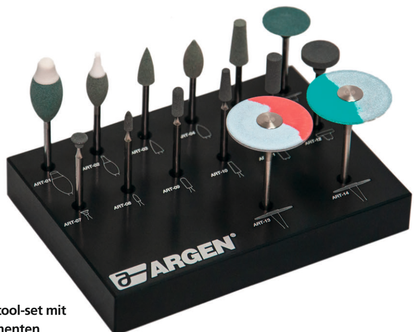
▣ Komplettes Zirkon tool-set mit 14 rotierenden Instrumenten

Mit 14 rotierenden Instrumenten zur perfekten Oberfläche bei Zirkonversorgungen – das Ziel erreichen Zahntechniker mit dem neuen Zirkon tool-set. Für eine besonders schonende und gleichzeitig effiziente Bearbeitung von Zirkon-Gerüststrukturen hat Argen Dental hochwertige Diamanten, Polierer und Gummiescheiben mit einer Schaftstärke von 2,35 mm zusammengestellt. Die rotierenden Instrumente für Zirkonoxid bieten dem Zahntechniker einen optimierten Abtrag bei wirtschaftlicher Standzeit an.