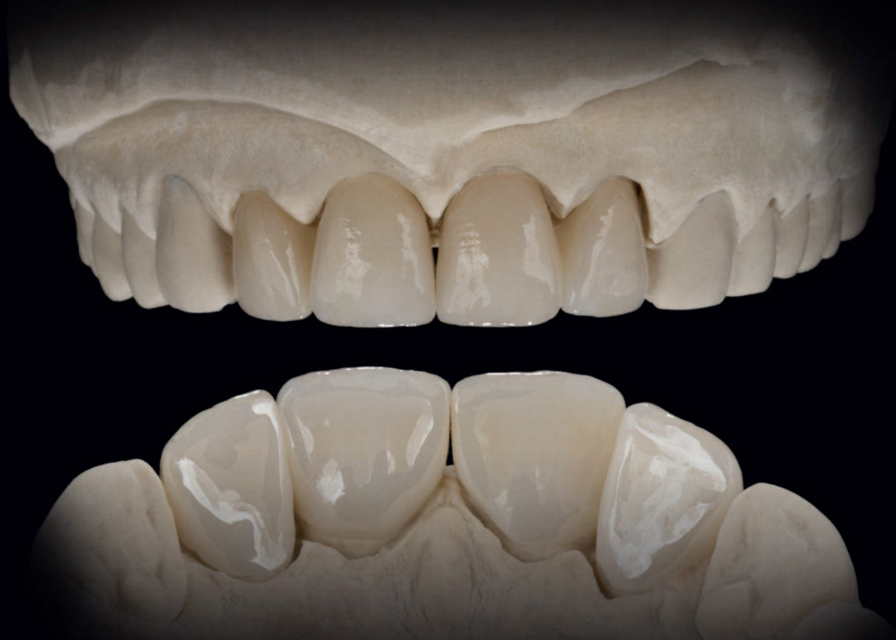
^ 16a/b Fertiggestellte Kronen (Zirkonoxidbasis und Micro-Layering) auf dem Modell. Palatinal monolithisch umgesetzt. Vestibulär mittels Micro-Layering veredelt.

len Situationen im No-Match. Dissonanzen erschweren die Arbeit. Der Gedanke, das Materialportfolio im Dentallabor zu reduzieren und nur wenige Multi-Layered-Rohlingen für „alle Fälle“ anzubieten, ist ambitioniert und großartig, doch das funktioniert im Alltag leider nicht. Einige Hersteller empfehlen mittlerweile, auf eine etwas hellere Farbe im Sortiment zurückzugreifen; beispielsweise soll statt einer A3 tendenziell eine A2 genutzt und die Restauration mittels Colouring angepasst werden. Dies scheint in einer Zeit, in der wir Reproduzierbarkeit benötigen, der falsche Weg. „Benötige ich eine A3, nehme ich eine A3“, so lautet unser Anspruch. ArgonZ HT+ Multilayer integriert sogee-