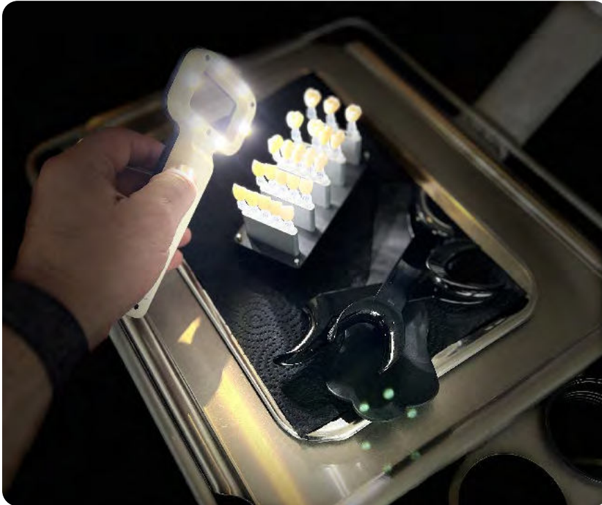
^ 07 Mögliches Equipment für die fotografische Dokumentation der Farbbestimmung als Grundlage für das Colour-Matching