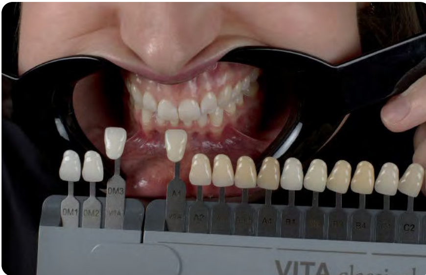
^ 08 Bestimmung der Zahnfarbe im Mund des Patienten mit konventionellem Vita-Farbschlüssel

Doch was steckt drin? Hier benötigen wir unsere „Zirkonoxid-Legierungstabelle“. Zirkonoxide differenzieren sich primär in den mechanischen und optischen Eigenschaften. Zunächst gilt es, die Generationen zu unterscheiden und hierfür ist die Herstellungsrezeptur zu betrachten. Grundlage bildet in der Regel tetragonales Zirkonoxid (TZP, tetragonal zirconia