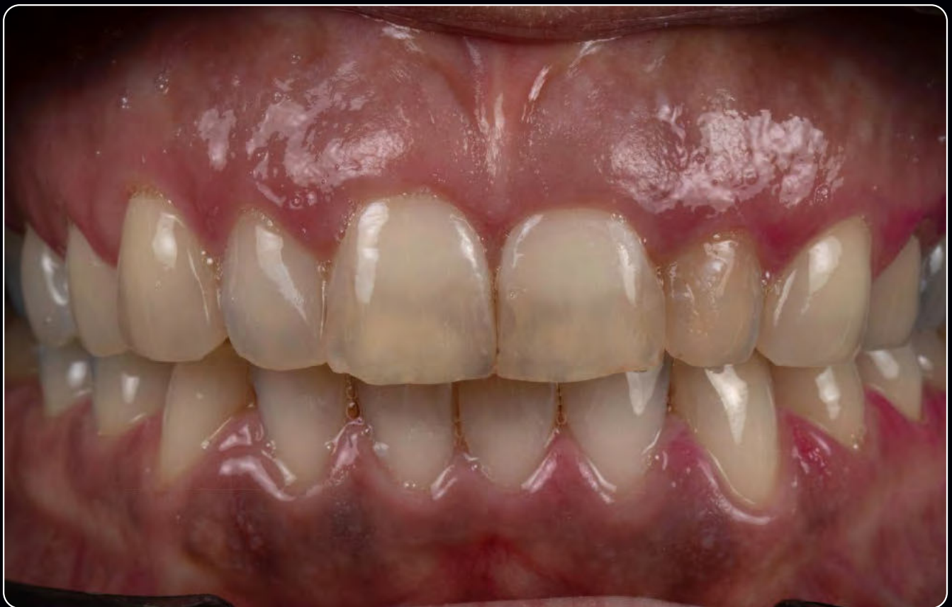
^ 15 Arbeitsauftrag: Vier vollkeramische Frontzahnkronen für eine junge Patientin: Sie kommt aufgrund der hohen ästhetischen Herausforderung zur Farbbestimmung in das Labor. Farbabgleich mittels Colour-Index (Bleachfarbe OM3, mit siebenschichtigem Farbverlauf, ArgenZ HT+ Multilayer)